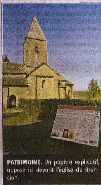
PATRIMOINE. Un pupitre explicatif, apposé ici devant l'église de Brancion.

Un travail titanesque de quelque 32 années d'efforts, durant lesquelles l'association a dressé, commune par commune, un inventaire systématique des édifices religieux édifiés datés des XI e et XII e siècles. Une collaboration étroite s'est ainsi nouée avec des écoles d'architecture de la Communauté européenne (en Pologne, Allemagne, Slovénie, Hongrie, Portugal), ainsi qu'en Amérique latine et en Asie. En 2022, « Les Chemins du Roman en Bourgogne du sud » ont été reconnus comme l'un des trente