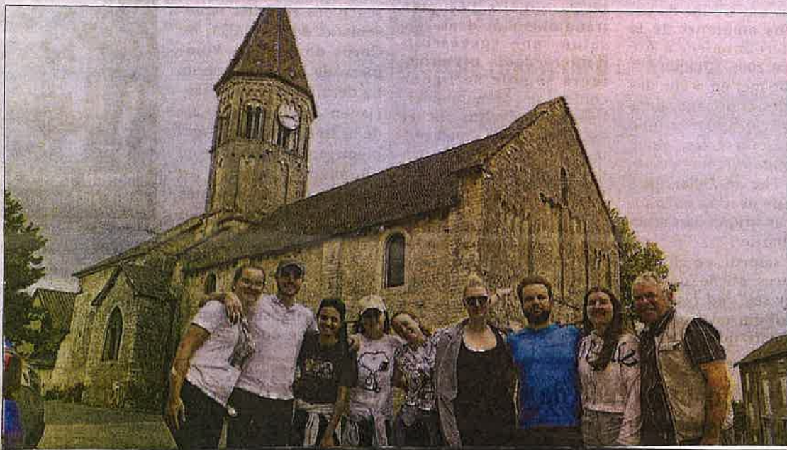
EUROPE. Des étudiants slovénes en visite à Clessé, en juillet dernier.

Après un été intense, entre les stages internationaux de relevés architecturaux et le 24 e festival Celtique en voûtes, le CEP (Centre international d'Études des Patrimoines culturels) du Charolais-Brionnais organise la 2 e session du grand colloque. Un événement qui célèbre le 30 e anniversaire de l'itinéraire des Chemins du Roman en Bourgogne du sud.