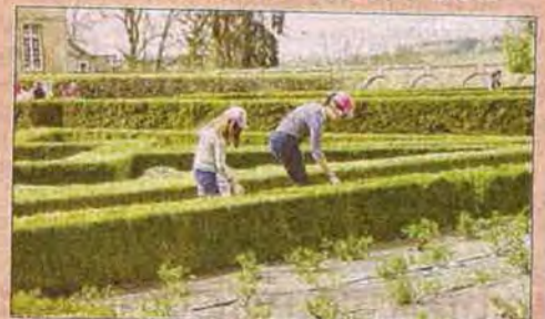
Une chasse aux œufs dans les jardins du château de Drée.

Les Rendez-vous aux jardins les 2, 3 et 4 juin, les nocturnes au château les 22 juillet et 12 août, Intimidée les 1 er et dernier dimanche de mai,