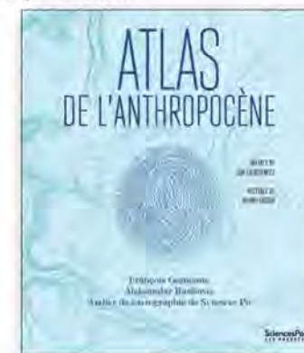
Couverture de l'Atlas de l'anthropocène (2020) L'anthropocène est la période actuelle de l'histoire de la Terre qui est marquée par l'impact de l'humanité sur l'écosystème terrestre.

Nous vous rappelons que la cotisation au CEP est déductible des impôts, à hauteur de 66 %; vous recevrez automatiquement le formulaire de déduction fiscale.