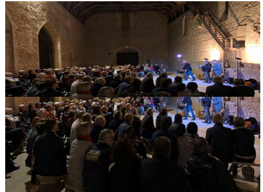
Concert au Couvent des Cordeliers, en 2019