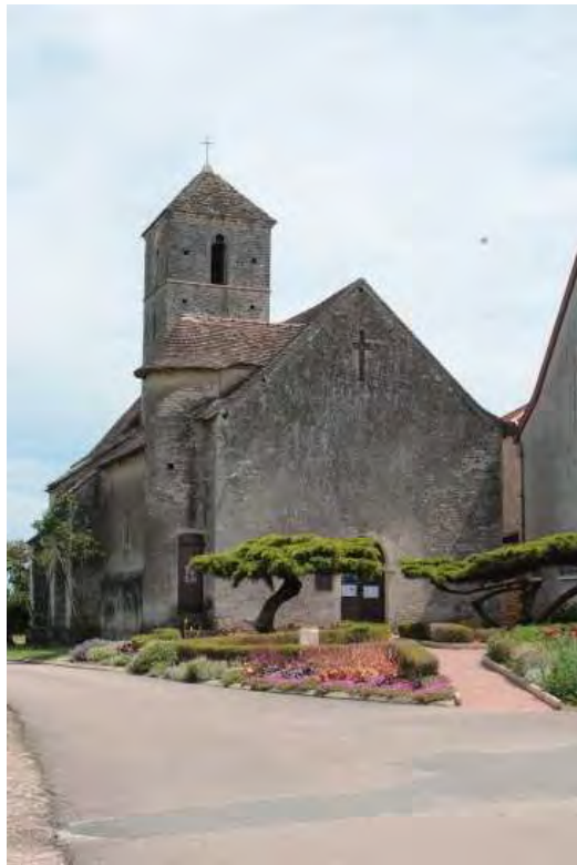
Eglise Saint-Oyen à Montbellet (Chapelle des Arts)

1. Le stage slovène : 1 er au 15 juillet 2023: Pour la 16 ème année (2006-2023), le CEP accueillera 6 étudiants de la Faculté d'architecture de Lubliana, sous la direction du prof. Ljubo Lah qui encadre les stages depuis 2006 (il y a eu deux années d'interruption, en 2020 et 2021 pour cause de Covid). Objectifs : les deux églises romanes de la commune de Montbellet ; l'église paroissiale Saint-Didier, et l'église Saint-Oyen (chapelle des arts).