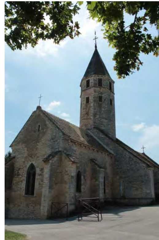
Eglise paroissiale Saint-Didier à Montbellet