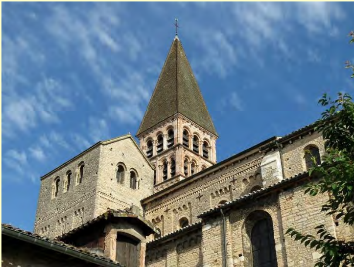
Abbaye Saint Philibert à Tournus