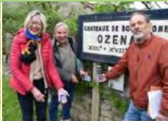
Balisage en Juin 2023