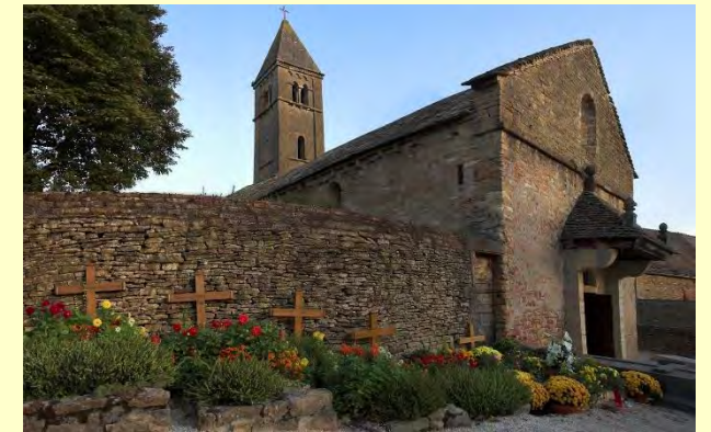
La communauté œcuménique de Taizé et l'église romane Ste Marie Madeleine