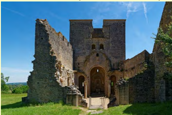
Les ruines de l'Église Saint Hippolyte, site Clunysien à Bonnay