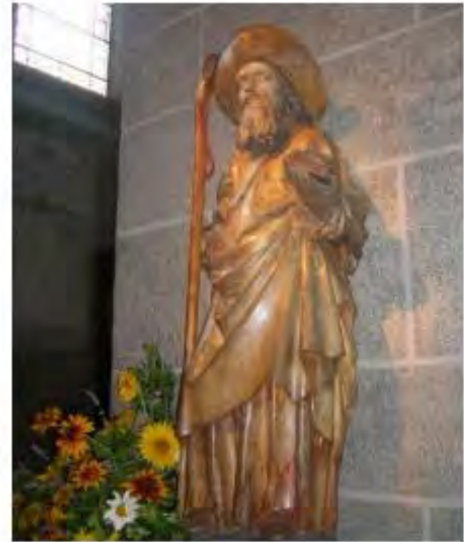
Saint Jacques (Le Puy en Velay)

Ô Saint Jacques, Soutenez-nous dans les dangers et allégez nos marches ; Soyez pour nous une ombre contre le soleil, un manteau contre la pluie et le froid ; Soyez le bâton qui évite les chutes et le port qui accueille les naufragés ; Afin que guidés par vous, nous atteignons avec certitude notre but, Et revenions sains et saufs à la maison.