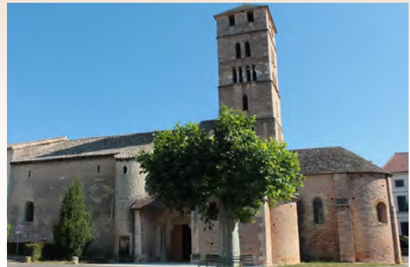
L'église romane d'Uchizy