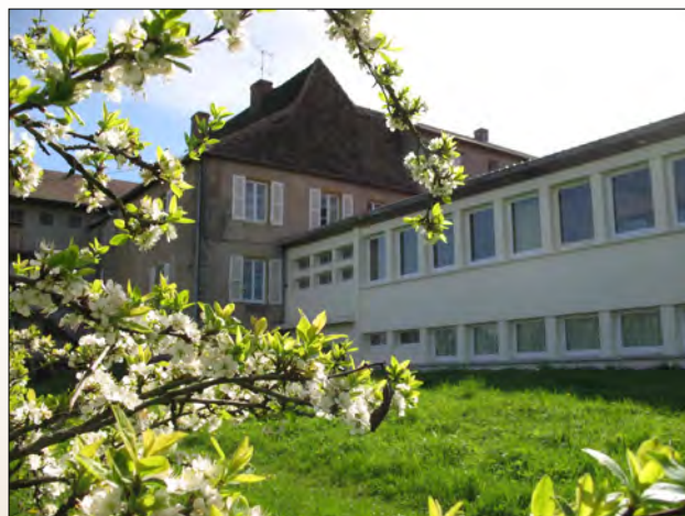
Le bâtiment du Montsac au printemps

documentation comprennent plusieurs milliers d'ouvrages spécialisés et revues scientifiques (en histoire, histoire de l'art, archéologie, économie, écologie) et aussi 50 000 journaux de la presse régionale, nationale et internationale. La bibliothèque du CEP, qui s'enrichit d'année et année, est de loin la plus riche de tout le territoire, pour le patrimoine.