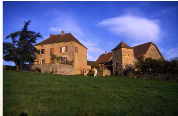
Maison ancienne (17 e -19 e siècles) au village de Giverdier, à Saint-Symphorien-des-Bois