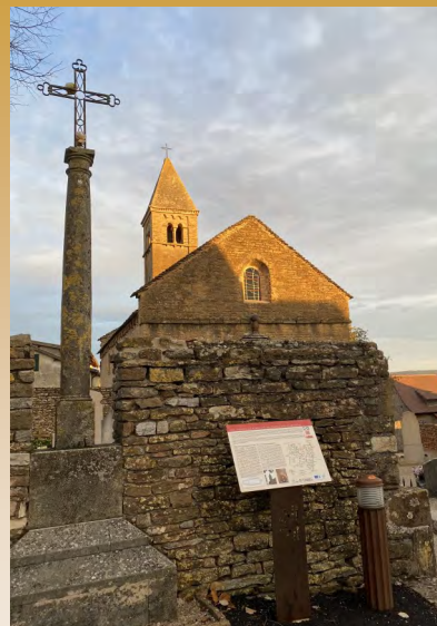
Eglise romane de Taizé