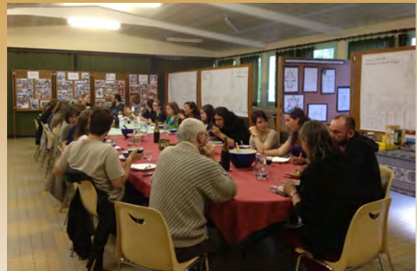
Les étudiants québécois en 2013