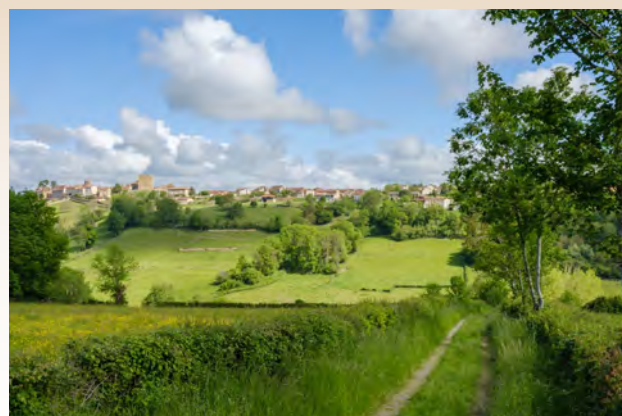
Paysage de bocage, avec au fond, le village de Semur-en-Brionnais