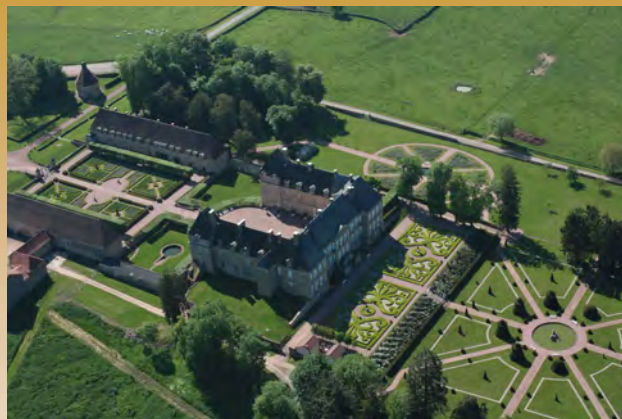
Le château de Drée

Le Charolais-Brionnais (qui reste le territoire de référence) : le CEP a recensé et mis en réseau plus de 100 églises et chapelles entièrement ou partiellement romanes (édifiées aux 11 ème et 12 ème siècles) autour de la basilique de Paray-le-Monial qui est un monument majeur de l'architecture clunisienne. Grâce à l'inventaire du CEP, le nombre d'églises romanes a littéralement explosé, puisqu'il est passé de 35 à 109 !