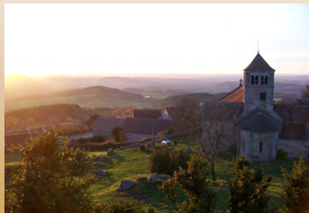
Eglise romane de Suin et panorama remarquable sur le Charolais