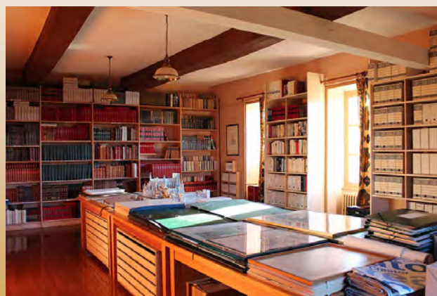
Le centre de documentation