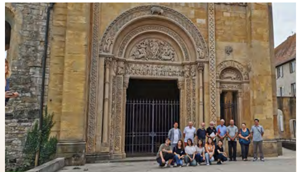
Les étudiants Chinois à Charlieu, en 2019