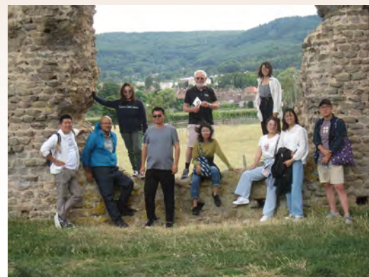
Les étudiants chinois à Autun, en 2019