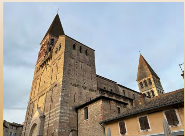
L'abbatiale Saint-Philibert de Tournus